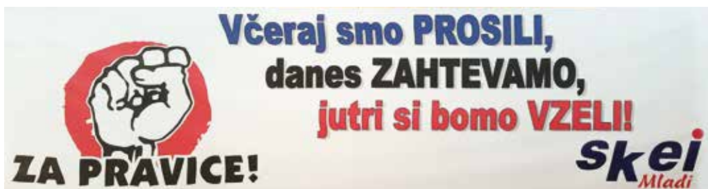
Največji slogan na kongresu.

»Od ustanovitve SKEI mineva že 25 let. Od takrat smo doživeli razpad Jugoslavije, spremembo sistema, propad velikega dela industrije zaradi izgube trgov, večkratno lastninsko preoblikovanje, vstop v EU, pre-