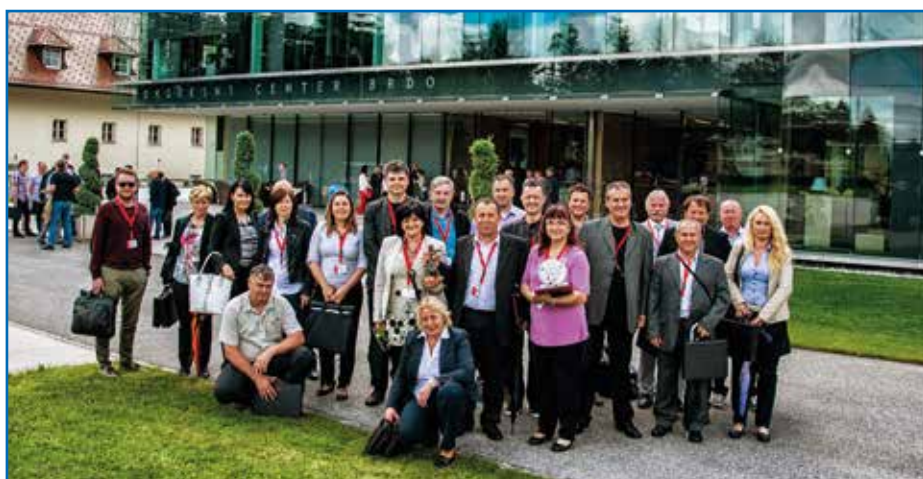
Delegati, nagrajenci in funkcionarji ReO SKEI Velenje.