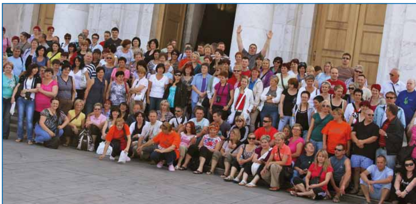
Utrinek iz enega izmed izletov v letu 2011

Še nekaj o nas. Ne sramujemo se naših slabosti. Zavedamo pa se, da se najbolj bojijo našega poguma in tega imamo.