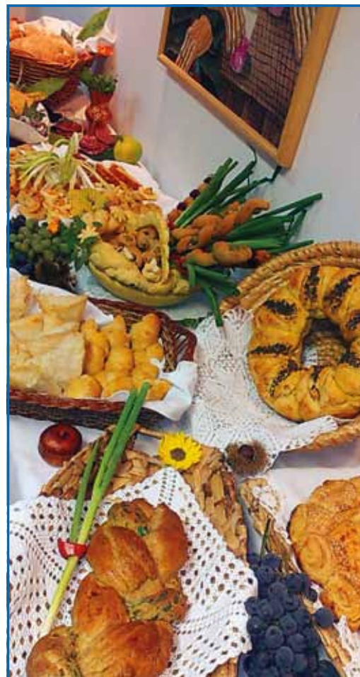
Razstava kruha, katerega so spekle delavke Gorenja

Lepo je, kadar čutiš zadovoljstvo med člani. Takrat so vse besede odveč in tvoj trud je poplačan. Pozorne smo tudi na majhne stvari, ki razveseljujejo naše člane. Vsako leto organiziramo tudi kakšen izlet, obdarimo naše članice ob 8. Marcu in Novem letu, organiziramo razne razstave, športne igre in podobno.