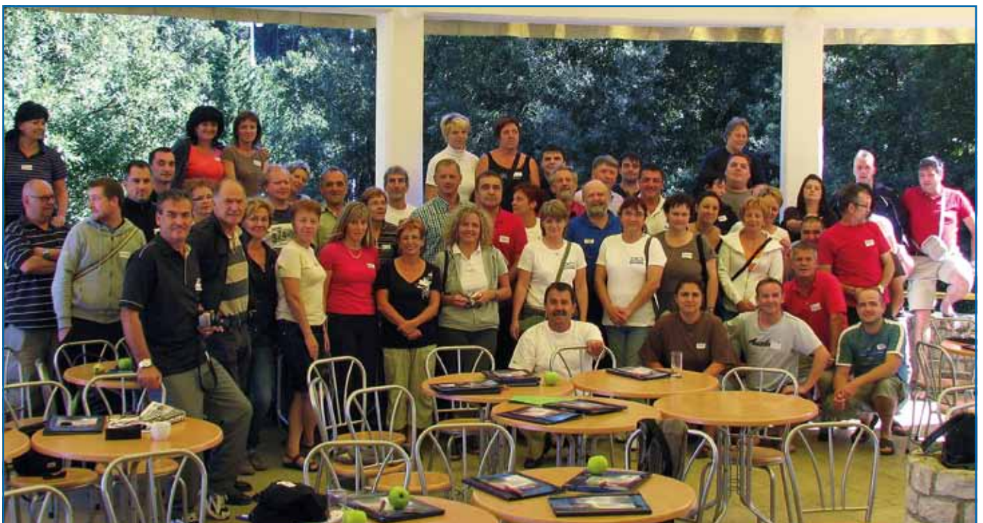
Organiziramo izobraževanja sindikalnih zaupnikov