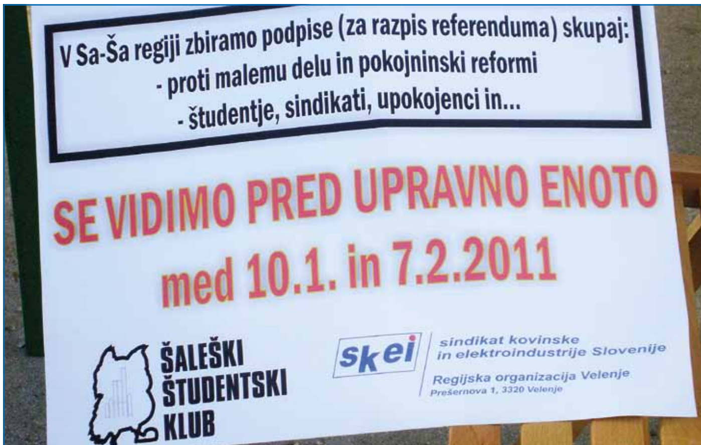
Uspešno zbiranje podpisov proti pokojninski reformi