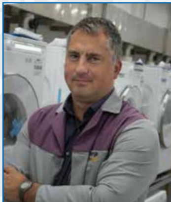
Krevh Mitja PSA