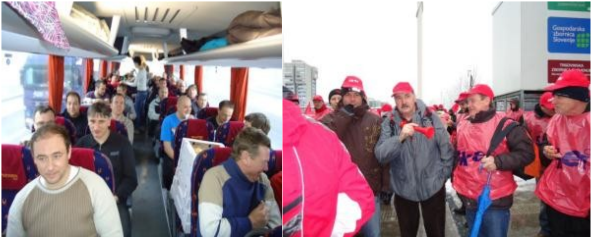
Udeleženci protestnega shoda na avtobusu in pred GZS dne 16.01. 2013

krajša prekinitev dela po zagotovilih predsednikov v podružnici Sip-Šempeter in Kiv-Vransko. Stavki so se pridružili tudi pogumni posamezniki v podjetju Unior-Zreče (ki pa so vzeli dopuste...) zakaj tako, lahko iščemo v specifičnem problemu in sicer notranji (ne)organiziranosti kar treh sindikalnih central...! V glavnini je bil protest speljan v korist naše pogajalske skupine, ki je lahko nadaljevala pogajanja z delodajalsko stranjo za tarifni del KP, ki določa plačno politiko in višino osnovnih plač v tarifnih razredih. (posledično tudi dodatkov...). V sindikalne podružnice sta bila poslana tudi dopisa predsednice SKEI-ja Slovenije in sicer o načinu in izvajanju plačila za dan stavke in pa odprto pismo ob udeležbi in podpori članstvu pri izvedbi stavke. Pred tem pa je bil izpeljan tudi protestni shod pred GZS v Ljubljani v podporo in nadaljevanju pogajanj naši pogajalski skupini.