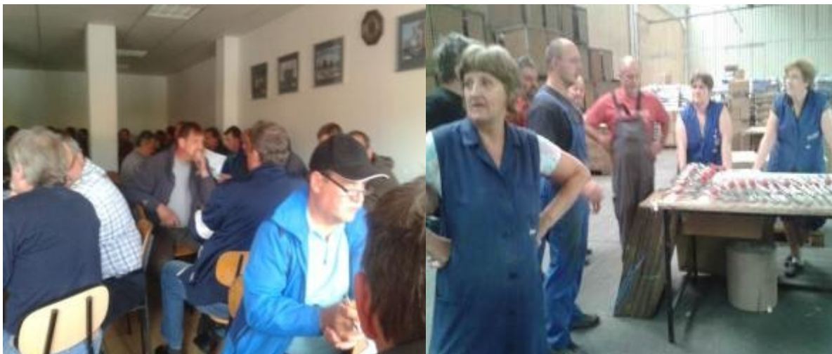
Nekaj utrinkov iz sklicanih sestankov, zborov zaposlenih v podjetjih, jedilnicah, pisarnah...!