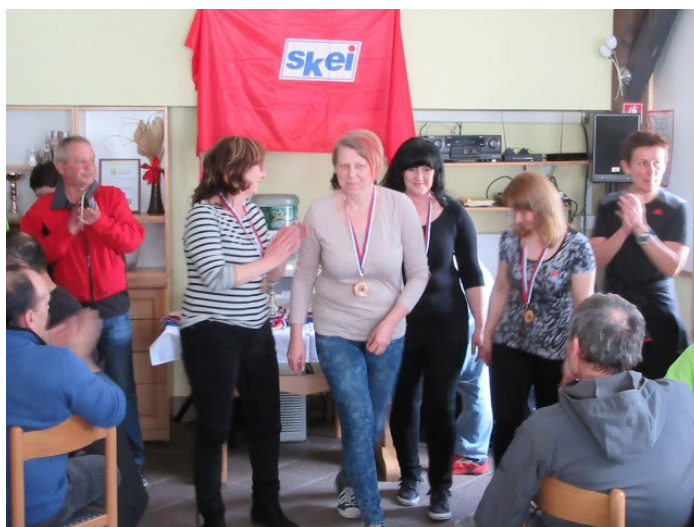
Sestanek IO SKEI Slovenije v podjetju ODELO v Preboldu