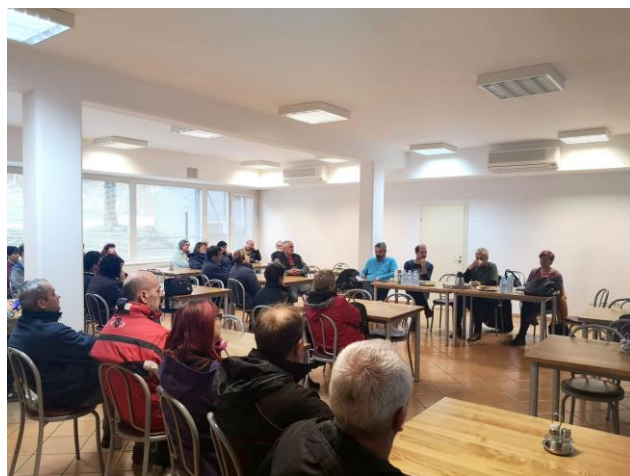
Hidria Rotomatika, Idrija

Na temo minimalne plače, poklicnega zavarovanja, ustanavljanja sveta delavcev in drugih težav, ki se pojavljajo v podjetjih, smo imeli zборе članov SKEI.