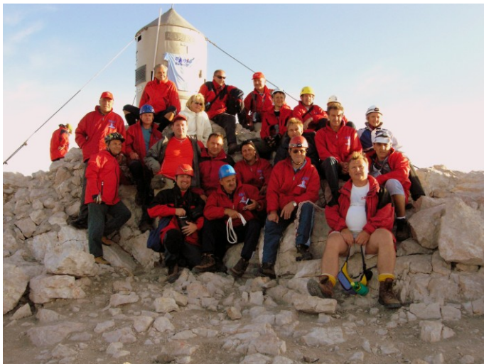
SKEI 1. na Triglavu 2007