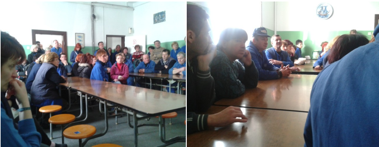
Utrinek iz sklicanega zbora delavcev v podjetju Emo-ETT

jasne zahteve sindikata v imenu vseh zaposlenih, da se mora prestaviti dejansko stanje v podjetju ali ima podjetje še perspektivo delati naprej ali pa se bo to zaprlo. Vsi povabljeni so prestavili oz. podali ocene iz katerih je bilo razbrati, da podjetje ne more več poslovati v naprej saj niti več ne izpolnjuje niti svojih minimalnih zakonskih dolžnosti do zaposlenih- (zamuja tekoče izplačevanje plač oz. se le te izplačujejo z eno mesečnim zamikom, za več zadnjih mesec niso več bili poravnani socialni prispevki in dajatve, dobavitelji grozijo z blokadami in tožbami)...Lastnik podjetja je na koncu zbora še enkrat povedal, da se bo najkasneje do konca meseca odločil za rešitev in v primeru zaprtja bo poskrbel, da bo vse terjatve delavcev tudi poplačal. Predstavniki zaposlenih smo že naprej v tem primeru opozorili, da bomo pozorno spremljali vse odločitve in da bomo zahtevali izpolnjevanje zakonskih določb v celoti tudi z sodnim varstvom. Sekretar je še na kratko prestavil pogajanja na državnem nivoju glede predlogov in sprememb nove delovno pravne zakonodaje in pogajanj za tarifni del KP dejavnosti. Konec meseca smo se še dvakrat sestali predstavniki sindikata oz. zaposlenih in uprave podjetja.